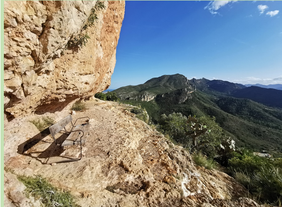
Tallat Roig, cima de Alzira, con banco.